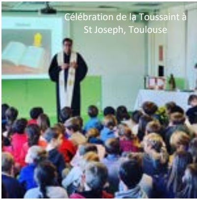
Célébration de la Toussaint à St Joseph, Toulouse

La Toussaint est une fête joyeuse , celle de la joie de tous les saints qui, nous le croyons, vivent pleinement de la communion d’amour, auprès de Dieu, pour toujours. A la Toussaint nous fêtons tous les saints , pas seulement ceux qui sont fêtés au calendrier, mais aussi la foule immense des saints inconnus , qui ont vécu, sont morts et qui sont auprès de Dieu, Vivants pour l’éternité. La fête de la Toussaint met en lumière la victoire de la Vie sur la mort.