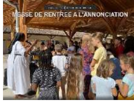
MESSE DE RENTREE A L'ANNONCIATION