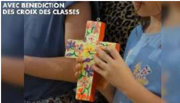
AVEC BENEDICTION DES CROIX DES CLASSES