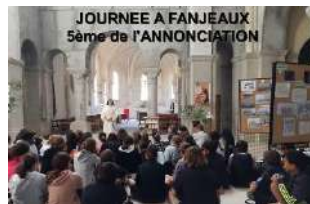
JOURNEE A FANJÉUX 5ème de l'ANNONCIATION