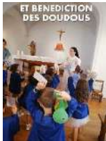
ET BENEDICTION DES DOUDOUS