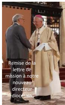
Remise de la lettre de mission à notre nouveau directeur diocésain