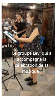
Le groupe LèV, qui a accompagné la célébration de sa musique !