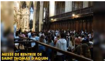
MESSE DE RENTREE DE SAINT THOMAS D'AQUIN

Voici une petite rétrospective en images de la rentrée dans les établissements Saint Thomas d'Aquin de Toulouse et l'Annonciation de Seilh, qui sont sous la tutelle des Sœurs Dominicaines du Saint Nom de Jésus :