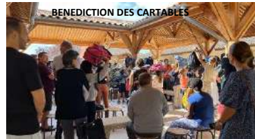
BENEDICTION DES CARTABLES