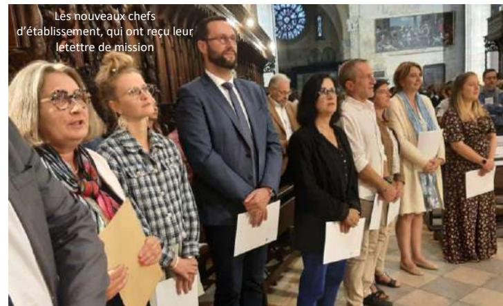
Les nouveaux chefs d'établissement, qui ont reçu leur lettre de mission