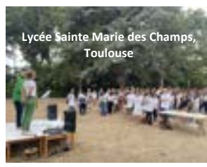
Lycée Sainte Marie des Champs, Toulouse

SMC se met au vert : préservons notre maison commune !