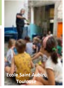
Ecole Saint Aubin, Toulouse