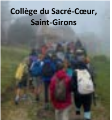
Collège du Sacré-Cœur, Saint-Girons

(Etablissement St François La Cadène, Labège)