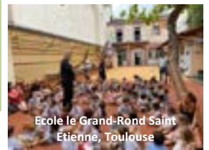
Ecole Le Grand-Rond Saint Etienne, Toulouse