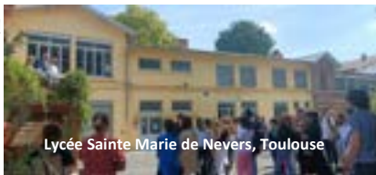
Lycée Sainte Marie de Nevers, Toulouse

(Ensemble scolaire Ste Thérèse, Saint-Gaudens)