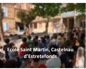
Ecole Saint Martin, Castelnau d'Estretfonds