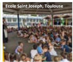
Ecole Saint Joseph, Toulouse

(Ensemble scolaire Saint Joseph, Toulouse)